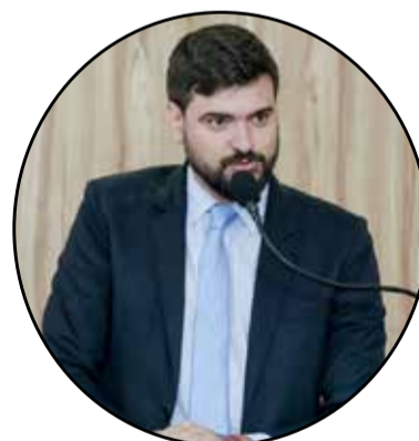
lias nos finais de semana. A moção foi aprovada por unanimidade.

O vereador destaca que essa prática já é comum em diversas cidades brasileiras, como Campinas. A iniciativa pode facilitar a circulação em áreas específicas, estimular o turismo local, melhorar o acesso a pontos turísticos e promover a inclusão social, além de ser uma alternativa de lazer para famílias nos finais de semana. A moção foi aprovada por unanimidade.