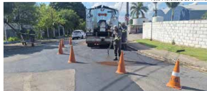
Rua Ezequiel Benedito Silva, Colina dos Pinheiros