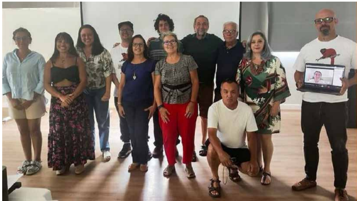
Integrantes da Diretoria e do Conselho Fiscal do Instituto Serra dos Cocais

Instituto nasce para proteger um dos biomas mais ricos e ameaçados do estado, unindo esforços de ambientalistas e da comunidade