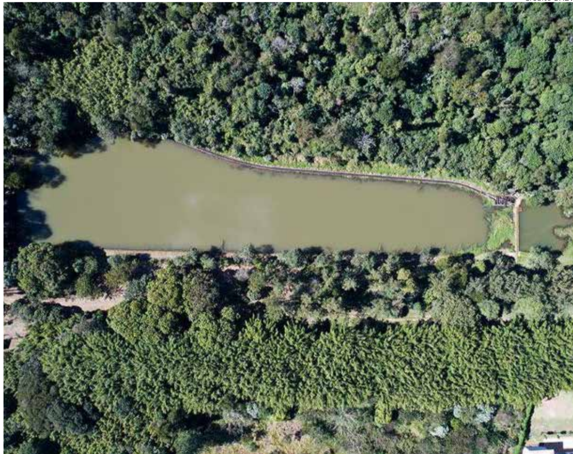
Desassoreamento da barragem João Antunes dos Santos será iniciado ainda no mês de fevereiro