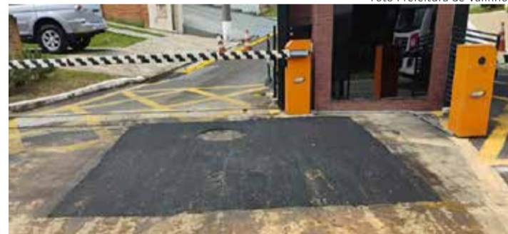
Rua Vice Pref. Anésio Capovila