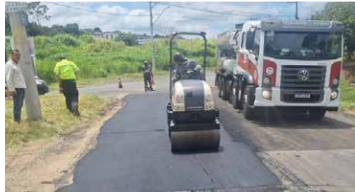
Operação Tapa-buraco - Rua Clark (Macuco)

DA REDAÇÃO A ‘Operação Tapa-Buracos’, realizada pela Prefeitura de Valinhos em várias regiões da cidade, está em ritmo acelerado. As equipes da Secretaria de Obras Públicas percorrem os pontos em condições mais críticas para mapear os buracos e programar os serviços. Essa semana o trabalho chegou ao bairro São Luiz onde é realizado em várias ruas.