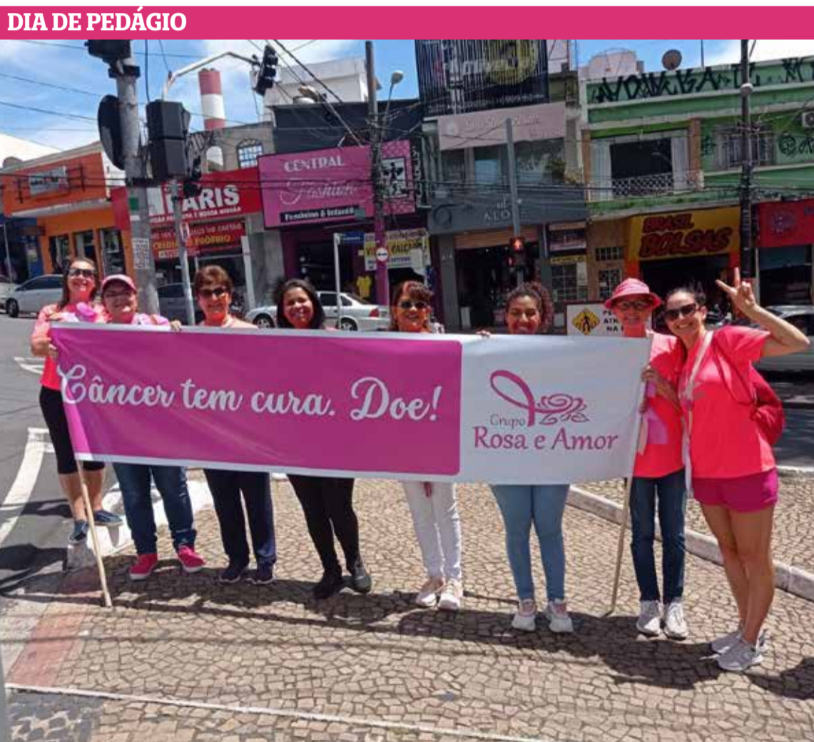
O Grupo Rosa e Amor realiza hoje, dia 19, o 3º Pedágio Solidário, das 9h às 12h, nos principais semáforos de Valinhos. Durante o evento, as voluntárias estarão distribuindo folders de conscientização sobre o câncer de mama e arrecadando doações para a entidade, que está em obras para ampliar sua capacidade de atendimento. Página 11