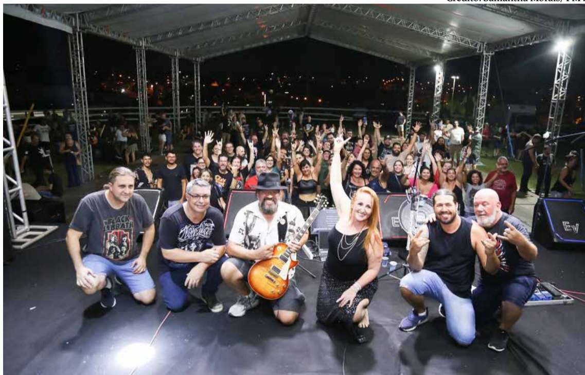
Banda Cover Rock, que fez show no primeiro domingo da Festa, dia 14

Já no domingo, dia 21, o espaço promete ficar ainda mais agitado, já que vai receber os participantes do Passeio de Motociclistas. Na data a programação totalizará seis atrações. São elas: às 12h, Banda Pendulun Creedence Cover; às 14h, Banda White Crow Rock; às 16h, Led Zeppelin Experience Brasil; às 18h, Banda Co-