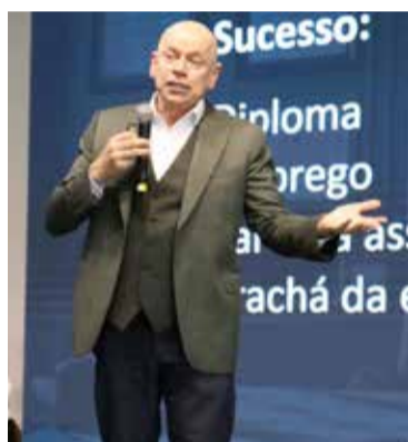
Professor Leandro Karnal

Além disso, o Fórum possibilitou que os profissionais da educação municipal compartilhassem suas próprias experiências e melhores práticas com outros profissionais da área, aprofundando sua compreensão sobre os desafios e perspectivas da educação no contexto regional.